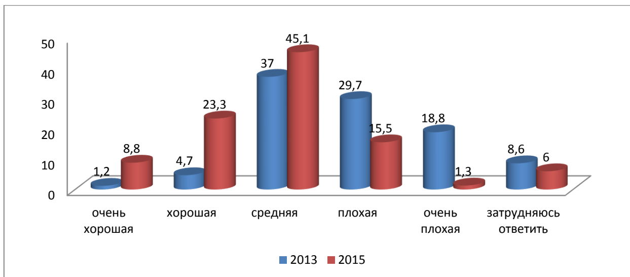
Рисунок 2. – Распределение ответов на вопрос «Как Вы оцениваете политическую ситуацию в России?»

Таким образом, можно сделать вывод о том, что современная молодежь недовольна своей жизнью и семейным положением. Причиной этому может служить то, что они хотят высокооплачиваемую работу, беззаботную жизнь и при этом веселиться и развлекаться. В результате они в меньшей степени интересуются политикой и практически не доверяют органам местного самоуправления. В свою очередь, именно образование и нравственное обогащение личности, по мнению респондентов, будет и должно воздействовать на возрождение России, несмотря на все негативные факторы мешающие этому процессу.