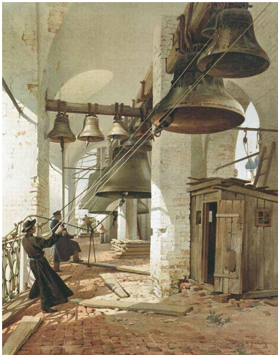
Виллие Михаил Яковлевич «Праздничный трезвон»