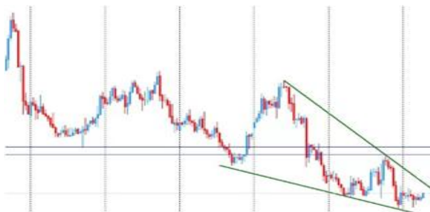
Рис. 1. Фигура «Нисходящий клин» в теханализе

Можно утверждать, что проводя технический анализ рынка и имея определенный набор формаций и фигур, имеющих место быть на бирже можно условно предсказать последующее изменение цены. В своих исследованиях нужно учитывать, что проведение технического анализа биржевых инструментов отдельно от фундаментального анализа не даст полную оценку рынка в целом. Поэтому на практике два вида анализов разделяют, однако при комплексном их необходимо использовать вместе.