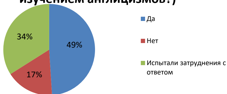
1.3.5. Диаграмма 5