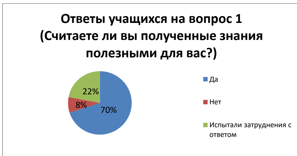
1.3.4. Диаграмма 4