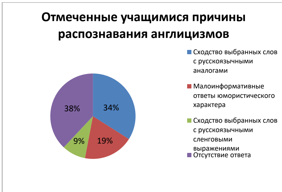
1.3.3. Диаграмма 3